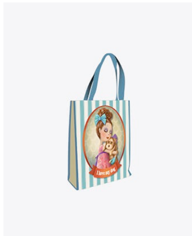
I love my dog