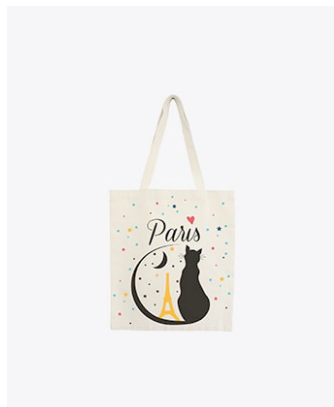
Paris Black Cat